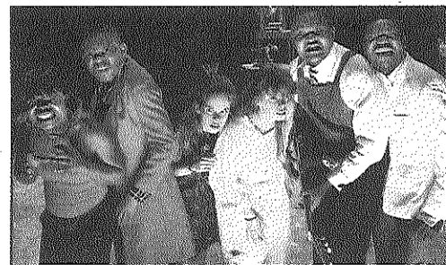
A l'attente du livre d'or.

Voor Bato Congo ging Theater aan Zee een samenwerking aan met de KVS, ILLI en het Vlaams Agentschap voor Internationale Samenwerking. Samen stelden ze een programma op dat het belang van cultuur voor duurzame ontwikkeling centraal stelt. Behalve Congolese producties zijn er ontmoetingen met Congolese artiesten in een ontspannen sfeer van concerten, expo's, salon- en nagesprekken, kinderteliers, workshops en zelfs een voetbalmatch.